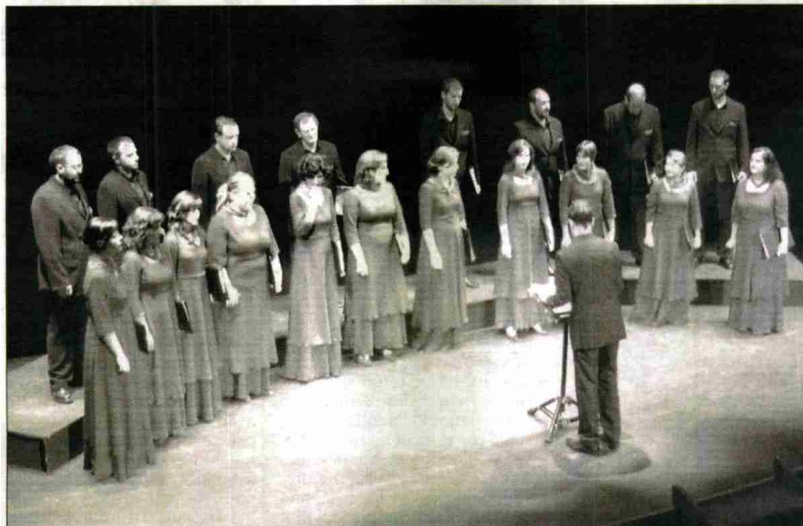
La Coral de Cámara, en la formación con que comenzó la segunda parte del concierto